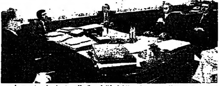
الرئيس الحص يناقش الخطوط الرئيسية للحديث في اجماع صباحي في مكتبه بوزارة الاعلام مع الزميلين جوري وعرفلت حجازي وبعض موظفي الوزارة.

مؤتمر البطارية والاساقفة الكاثوليك انهي أعماله أمس وأصدر بيانته الختامي مركزا على القضايا الأساسية المصرية في الظروف الراهنة وأمام توصيات المؤتمر: • رفض التقسيم بجميع أشكاله. • إعادة توحيد لبنان على أسس سليمة وفق صيغة تجتنب التعرض للفتنة والتفكك. • فرض السيادة على كل شبر من لبنان وعلى كل إقليم فيه. • تحديد نسبة وجود الفراه في لبنان. • الاسراع في بناء جيش قومي. • إعادة المهجرين الى بيوتهم وأماكنهم. • رفض الفاء الطائفية المسيحية مبرحليا، والمطالبة بالفتنة على اتواعها عندما تتوفر الظروف. • دعم الرئيس سركيس على طريق الحرية المسؤولة والسيادة الكاملة والوثاق التام. • التنازل على الصيغة الثالثة. الوضع في الجنوب بعد انتهاء المؤتمر تحدث غبطة البطريرك خريش في لقاء صحافي عن الوضع في الجنوب فقال: ان ما يلحق من الوضع هناك يدعو الى الاسف العميق، فالتقسيم يمتدحون شيئا فشيئا، فهم يحاصرون مختلف الجهات في منطقة القري الحدودية. وإذا بقي الوضع على حاله، بنذر بشر مستطير، لذلك نحن نكفر ما طلبناه منذ بدء الأحداث، من الدولة ومن الجميع، بان يصمروا هذه القضية الاصلية التي تستحق. وإذا بقي الوضع على ما هو عليه، فإنه ينقل من سي الى اسوأ، وقد يكون كارثة على الجنوب وحسب. - البقية على الصفحة ٧ -